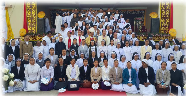
သူတော်စင်များဂျူဘီလီနှစ်ပိတ်ပွဲ (၈-၉)