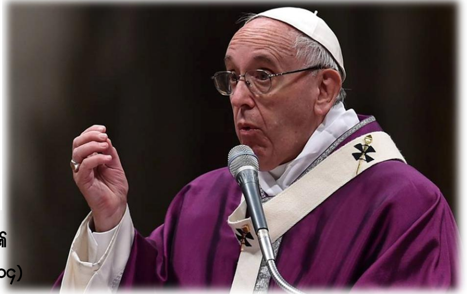
သနားကြင်နာခြင်း၏ သာသနာပြုများ (၈-၁၄)