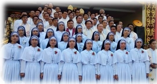
ပထမနှင့် ရာသက်ပန် သစ္စာခံယူခြင်း (စာ-၁၁)