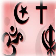
ယုံကြည်မှုမတူသူများတွေ့ဆုံ ဆွေးနွေးဖလှယ်ခြင်း (စာ-၂ )