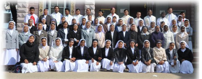
လားရှိုး သူတော်စင်များနှစ်ပိတ်ပွဲ