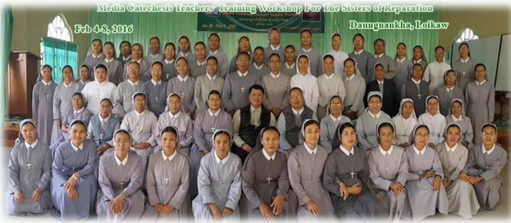
Media Catechesis Teachers' Training Workshop For The Sisters of Reparation