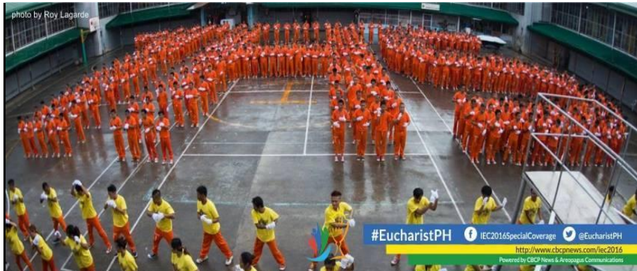
ကာဒီနယ်များစီတို ဖိလစ်ပိုင်နိုင်ငံ ဆီဘူးအကျဉ်းထောင်သို့ ကြွရောက်အားပေးနေစဉ် (၈-၃)