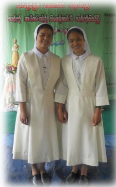
လာလောက်ကြယ်နှစ်ပွင့် (စာ-၁၁ )