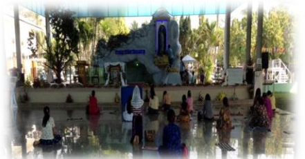
(၁၁၄) ကြိမ်မြောက် ညောင်လေးပင်လုဒ်မယ်တော်သခင်မပွဲတော်ကြီး