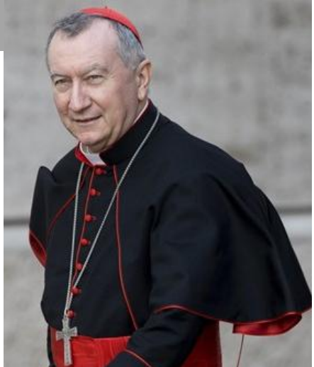
ဗဟိုကန်၏အတွင်းရေးမှူး Card. Parolin ကာဒီနယ်ပါရောလင်း

ဗဟိုကန်၏အတွင်းရေးမှူးကာဒီနယ်ပါရောလင်းသည်ဂရေဂေါ်ရီးယားနားတက္ကသိုလ်တွင်၆၊ ၂၊ ၂၀၁၆နေ့ ကျင်းပပြုလုပ်သောအစည်းအဝေး၌ ကက်သလစ်ရဟန်းတို့၏ငယ်ဖြူကျင့်စဉ်အကြောင်းအဓိကမိန့်ကြား ခဲ့သည်။ထိုအစည်းအဝေးတွင်ရဟန်းတို့၏ဂိုဏ်းတော်နှင့်ပတ်သက်၍ အတိတ်၊ပစ္စုပန်၊အနာဂတ်ကာလ သုံးပါးကို ပြန်လည်သုံးသပ်သည့် အစည်းအဝေးဖြစ်သည်။ ငယ်ဖြူဘဝသည်လိုအပ်ချက်ကြောင့်ဥပဒေ တစ်ခု အဖြစ်ထည့်သွင်း ထားသော်လည်း၊ သာသနာတော်ကြီးမှ အတင်းအကြပ် စီမံထားခြင်း မဟုတ်၍ လွတ်လပ်စွာရွေးချယ်ခွင့်ပြုထားကြောင်း၊ လာတင်းဂိုနည်းတော်ကို လိုက်သောသာသနာများ၌၊ ပိုမို ဂရုစိုက်ရန်လိုအပ်ကြောင်း၊ အဘယ်ကြောင့်ဆိုသော် ဤဂိုဏ်းတော်သည် ဆရာတော်များနှင့် သစ္စာသုံးပါးခံသောတော်စင်များအတွက်သာမက ရဟန်းတစ်ပါးအတွက်မရှိမဖြစ် ကျင့်ဝတ်တစ်ပါး ဖြစ် ကြောင်း၊ ငယ်ဖြူဂိုဏ်းတော်ကြောင့် ခေါ်တော်မူခြင်းလမ်းစဉ်လျှောက်လှမ်းသူများနည်းပါးကြသည် ဟုဆိုပါလျှင် ဆက်စပ်မှုရှိသည်ဟု မထင်ပါကြောင်း၊ လတ်တလောလိုအပ်ချက် တစ်ခုတည်းကိုသာ ကြည့်၍ အလောသုံးဆယ်မဆုံးဖြတ်စေလိုကြောင်း၊ ဧဝံဂေလီတရားကို ဟောပြောသက်သေခံခဲ့သောသူ များအား ပြန်လည်ကြည့်ပါလျှင် အသွင်မတူသောဘဝပုံစံများဖြင့် ရှင်သန်ဟောကြားခဲ့သည့် အစဉ်အလာ များရှိခဲ့ကြောင်း၊ ထို့ကြောင့်ငယ်ဖြူဘဝကို ဆက်လက်ထိန်းသိမ်းကျင့်ကြံခြင်းသည် ဧဝံဂေလီသတင်း ကောင်းဟောကြားခြင်း၌ ပိုမိုထိရောက်စေသော အကြောင်းတရားနှင့်အတူ အကျိုးတရားများရှိမရှိ ဆိုသည်ကို ပွင့်လင်းစွာ တင်ပြဆွေးနွေးခြင်းခန့်ခွင့်ပြုထားမည် ဟုမိန့်ကြားကြောင်း ဗဟိုကန်ရေဒီယိုမှ သတင်းရရှိပါသည်။ (ကိုပိုက်)