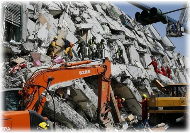
ထိုင်ဂမ်မြေလျင် (စာ-၉ )