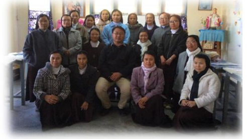
ခေါင်းဆောင်မှုသင်တန်း (စာ -၁၂)