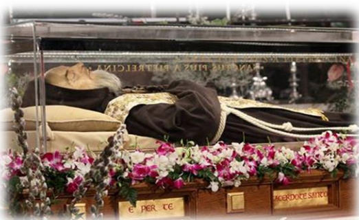
ရဟန္တာပီးအို (၈-၂)