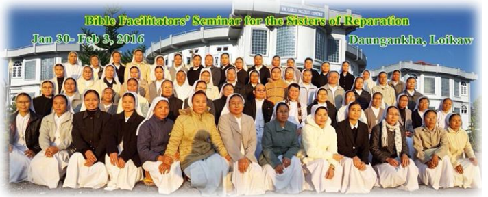
သမ္မာကျမ်းစာဦးဆောင်သူများသင်တန်း (စာ-၆)