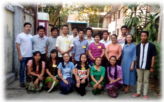
လူကုန်ကူးမှုဆန့်ကျင်ရေး သင်တန်း(၈- ၇)

CBCM - စာစောင်ကို လ၏ (၁၅) နှင့် (၃၀) ရက်နေ့တို့တွင်ထုတ်ဝေသည်။ Herald - တစ်စောင်(၃၀၀)ကျပ်ဖြစ်၍ တစ်လကိုနှစ်စောင်လျှင်(၅၀၀)ကျပ်၊ တစ်နှစ်စာကို (၆၀၀၀)ကျပ်ဖြင့်အားပေးနိုင်ပါပြီ။